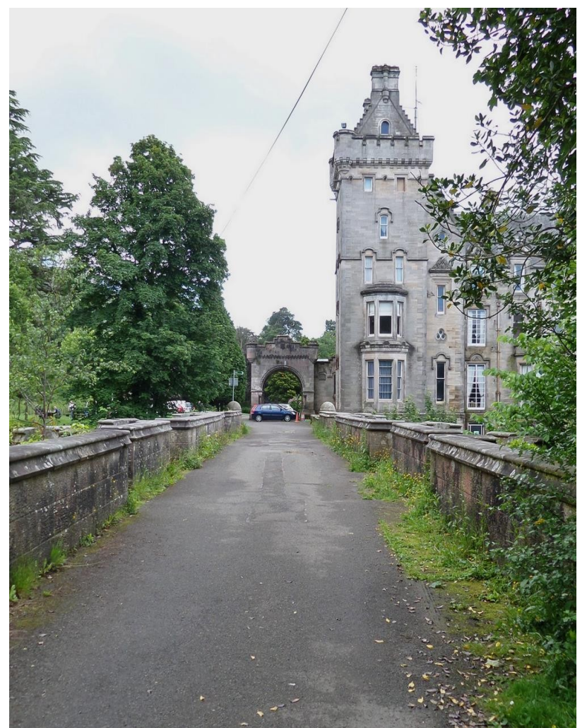
Le Pont d'Overtoon, en Ecosse.

Sources : www.dark-stories.com https://fr.wikipedia.org/